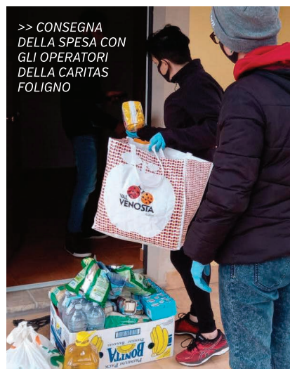
>> CONSEGNA DELLA SPESA CON GLI OPERATORI DELLA CARITAS FOLIGNO

Per questo abbiamo sconvolto i progetti che avevamo in mente per questo 2020 e abbiamo scelto di essere "Distanti ma vicini alle famiglie" proprio come abbiamo chiamato questo progetto iniziato prima con la Caritas di Gubbio e poi esteso anche a Foligno.