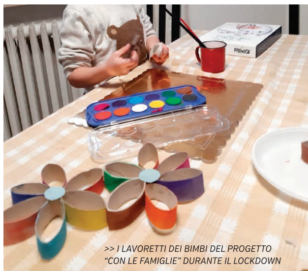
>> I LAVORETTI DEI BIMBI DEL PROGETTO "CON LE FAMIGLIE" DURANTE IL LOCKDOWN

Sin dalla nascita della Fondazione l'educazione è stato uno degli ambiti di intervento predominanti, con diverse progettualità. Ne sono un esempio i progetti in Kenya e in Burkina Faso dove ogni anno oltre 50 bambini hanno accesso allo studio, come non mancano interventi sul nostro territorio dove con il progetto "Con le famiglie" supportiamo i bimbi appena nati nei loro primi mille giorni, per garantire a tutti la migliore partenza possibile.